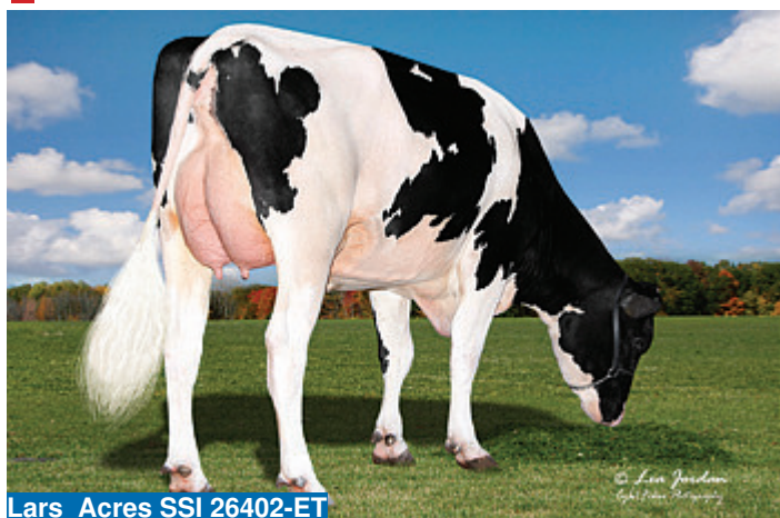
Lars Acres SSI 26402-ET